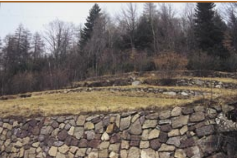
Steinmauern zeigen Spuren der ehemaligen Getreideäcker Muretti di sassi testimoniano la presenza di antichi campi di cereali

Anterivo è un paesino di montagna situato a 1200 m di altitudine al confine tra l'Alto Adige ed il Trentino e segna quindi il confine linguistico tra l'area italiana e quella tedesca. Per la sua posizione geografica il comune di Anterivo si estende infatti su una lingua di terra che si insinua nel territorio della provincia di Trento, a cui già appartiene il vicinissimo comune di Capriana. Il comune conta circa 380 abitanti. Nonostante l'altitudine, Anterivo gode di un clima particolarmente favorevole, in quanto situato su una terrazza soleggiata esposta verso sud. La località si trova immersa nell'area del Parco Naturale Monte Corno ed il centro del paese è incorniciato