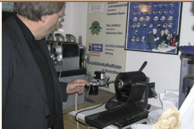
Proberöstung des Altreier Kaffees in der Rösterei Hagen, Heilbronn, Juni 2005 Tostatura di prova del Caffè di Anterivo nella tosteria Hagen, Heilbronn, giugno 2005

I singoli ingredienti venivano tostati separatamente, poiché l'orzo, il frumento ed il lupino Caffè di Anterivo hanno bisogno di tempi diversi per giungere alla tostatura. In alcune zone il caffè veniva