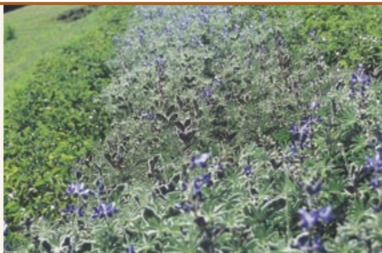
Pflanzen der Lupine "Altreier Kaffee" Pianta del tipo di lupino "Caffè di Anterivo"