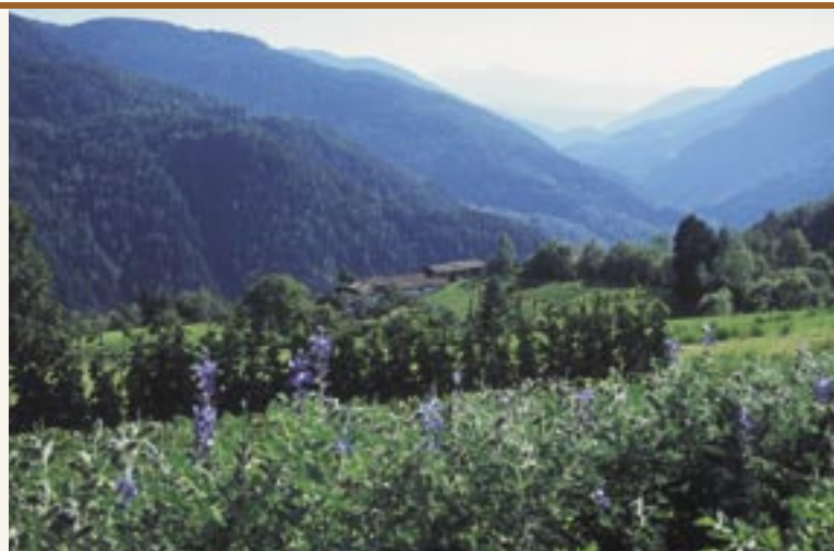
"Kaffeeacker" mit Blick ins Cembratal "Campo di caffè" con vista sulla Val di Cembra

Il caffè di Anterivo è parte della memoria collettiva degli abitanti dell'omonimo paese; molti di loro lo hanno coltivato e/o bevuto personalmente, altri ricordano di averlo visto coltivare dalle loro madri, nonne o zie. Per documentare quest'arte locale e consolidare il ricordo storico e culturale del Caffè di Anterivo, sono state realizzate, avvalendosi degli strumenti della ricerca sociale qualitativa, 11 interviste alla popolazione locale che poi sono state registrate su nastro. Poiché alcuni colloqui hanno visto coinvolti 2 o più interlocutori, in totale le persone che vi hanno preso parte sono state 15. I colloqui sono stati condotti sotto forma di interviste semi-strutturate,