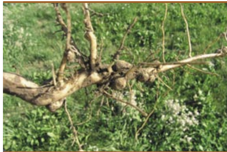
Knöllchenartige Verdickungen an den Wurzeln

che gli ha consentito di analizzare in breve tempo vaste popolazioni di piante, lo scienziato Reinhold von Sengbusch ha potuto determinare il contenuto di alcaloidi di un elevato numero di esemplari. Su un campione di 1,5 milioni di individui è riuscito a selezionare 3 piante di lupini gialli e 2 piante di lupini blu praticamente prive di queste sostanze amare, creando così il presupposto per la selezione dei cosiddetti "lupini dolci". 16 Insieme a quelli di soia i semi del lupino dolce sono i semi a più elevato contenuto proteico e di sostanze grasse. Si definiscono "dolci" le specie il cui contenuto di alcaloidi si trova sotto la soglia dello 0,03%. 17 Le specie più antiche di questi lupini presentano livelli di alcaloidi più alti che dovevano essere rimossi, mettendo ripetutamente a bagno i semi prima del loro consumo.