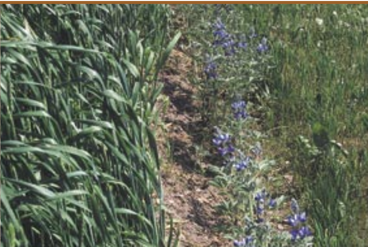
Meist wurde der "Altreier Kaffee" in einer Zeile am Getreideacker angebaut Di solito il "Caffè di Anterivo" veniva piantato in una fila nei campi di cereali

Il lupino, al contrario del fagiolo, che pur appartiene alla stessa famiglia, non soffre il gelo. Al contrario, se viene piantato presto, l'umidità accumulata dal terreno nel periodo invernale accelera la germinazione ed accresce la probabilità che le piante in autunno possano giungere a completa maturazione. Interrogata su come