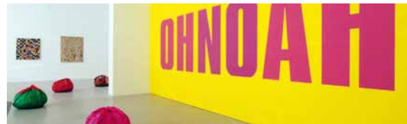
© Che cosa sono le nuvole? Opere dalla Collezione Enea Righi, Museion (2010) - Foto: Ivo Corrà

Museion - Museo d'arte moderna e contemporanea, Via Dante 6, tel. 0471 223411, www.museion.it