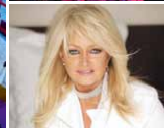
© Foto palcoscenico sul lago: allesfoto.com - La bella e la bestia: Gallissas Verlag - Bonnie Tyler: Semmel Concerts