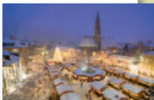
Azienda di Soggiorno e Turismo BZ/A. Filz

Dal 25 novembre al 23 dicembre: Per l'appuntamento più atteso dell'anno Bolzano, da sempre punto d'incontro della cultura mediterranea e mitteleuropea, si trasforma e si veste dei suoni e dei colori del Natale: centinaia di luci illuminano le vie del centro storico e nel sottofondo si odono le tradizionali melodie dell'Avvento. La piazza Walther ospita le caratteristiche casette in legno del "Christkindlmarkt"; 80 espositori propongono tipici addobbi e specialità gastronomiche e deliziosi dolci natalizi come il famoso "Zelten" di Bolzano. Novità: un mercatino dedicato ai bambini sorprenderà grandi e piccini. Orari d'apertura: lunedì - venerdì ore 10-19, sabato ore 9-20, domenica ore 9-19 e dall'8 all'11 dicembre 2011: ore 9-20.